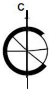
Схема земельного участка М 1:500