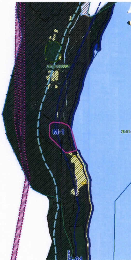
земельный участок с кадастровым номером 28:01:080001:15

к проекту постановления администрации города Благовещенска «О предоставлении разрешения на условно разрешенный вид использования земельного участка с кадастровым номером 28:01:080001:15 в квартале М-1 п. Мухинка города Благовещенска»