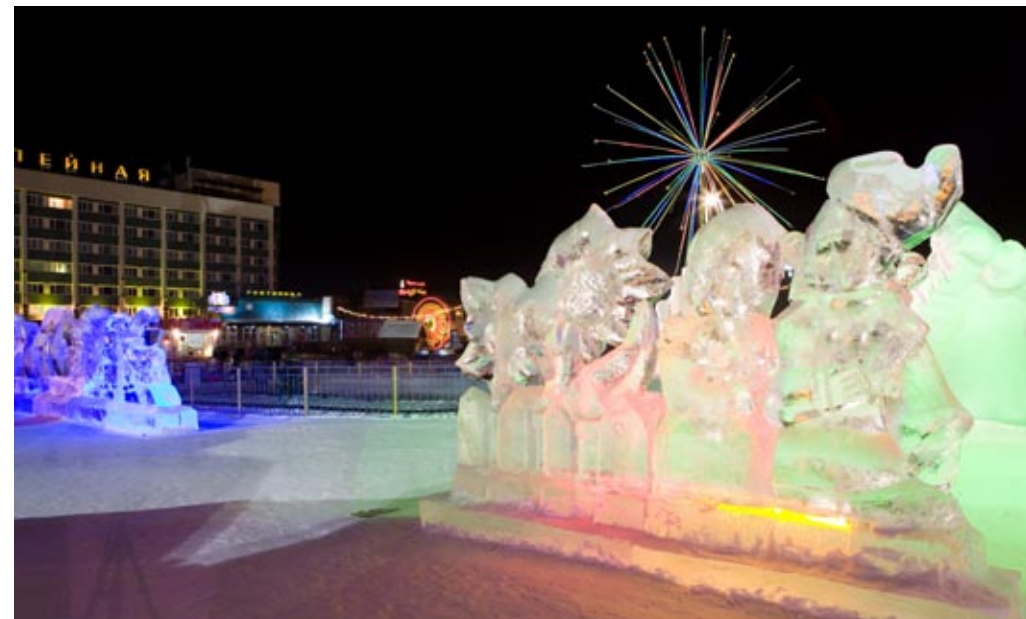
Традиционный снежный городок в центре Благовещенска в 2009 году стал особенно ярким и светлым

Особенностью зимнего сезона 2009 года стали аллеи светящихся елей, выросшие